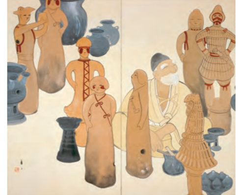
《埴輪》 都路華香 1916年 京都市立近代美術館蔵

ハニワに囲まれたおじいさんが、ニコニコ笑っています。右の人は板に何かを乗せて運んでいるようです。昔風の服を着た二人は、なにをしているのでしょうか。ここは発掘の現場でしょうか？ おじいさんの前には道具があり、板ののったものたちは焼く準備ができて窯にはこぼれているところなのでしょう。人の形のハニワがつくられたのは5～6世紀ごろのこと。およそ100年前につくられたこの作品は、はるか昔を想像して、ハニワをつくる様子をえがいたのですね。