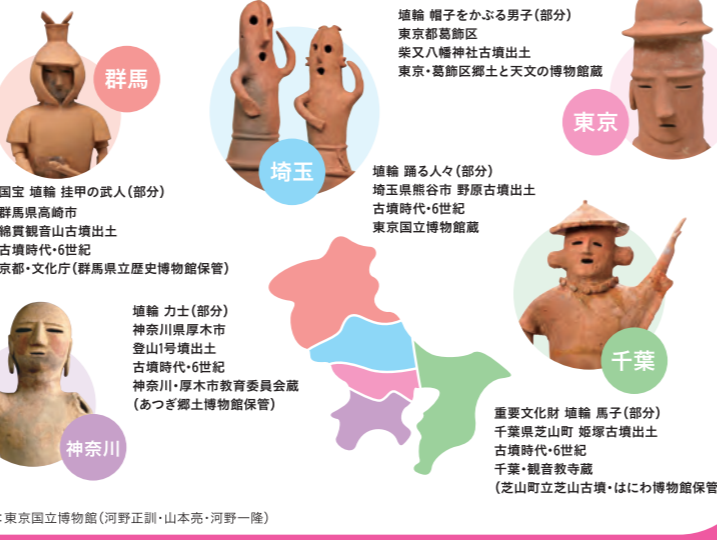
群馬 国宝 埴輪 挂甲の武人(部分) 群馬県高崎市 鏡貴観音山古墳出土 古墳時代・6世紀 京都・文化庁(群馬県立歴史博物館保管)