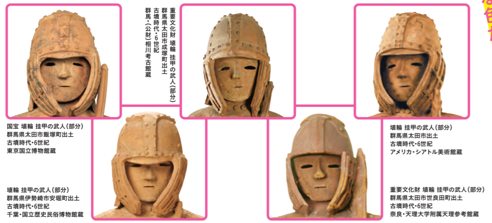
国宝 埴輪 挂甲の武人(部分) 群馬県太田市飯塚町出土 古墳時代・6世紀 東京国立博物館蔵

国宝「埴輪 挂甲の武人」には、同じ工房で製作された可能性も指摘されるほど、兄弟のようによく似たはにわが4体あります。5体勢ぞろいでの展示は史上初！ ようやく巡り合えた兄弟たちの雄姿を見に来てね！