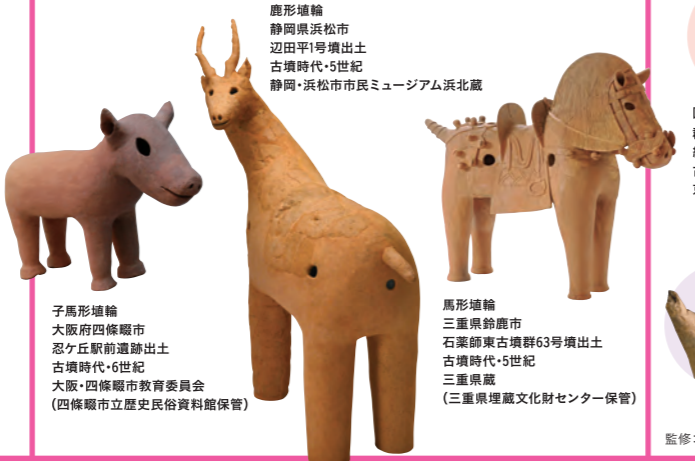
子馬形埴輪 大阪府四條畷市 忍ヶ丘駅前遺跡出土 古墳時代・6世紀 大阪・四條畷市教育委員会 (四條畷市立歴史民俗資料館保管)

古墳からは、馬、鹿、鳥、犬、猪など、実にさまざまな動物の埴輪が発見されています。また、同じ鳥でも鶏、鷹、白鳥などが作られました。