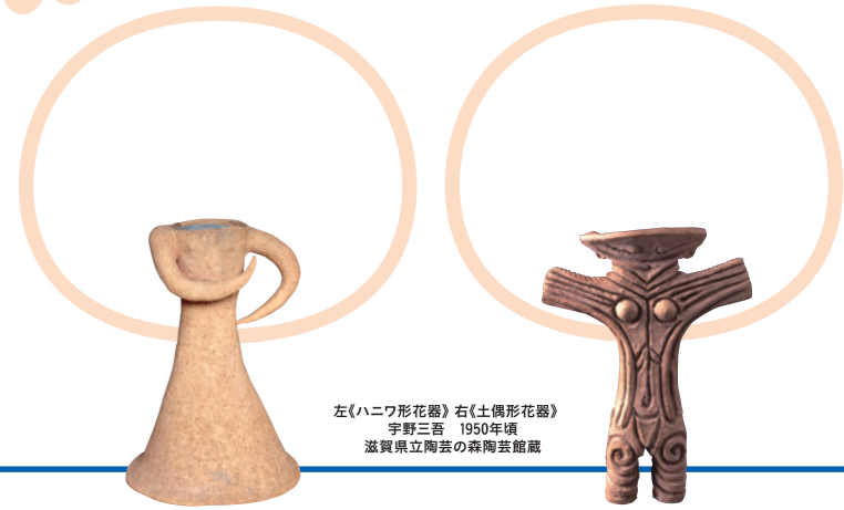
左《ハニワ形花器》右《土偶形花器》 宇野三吾 1950年頃 滋賀県立陶芸の森陶芸館蔵