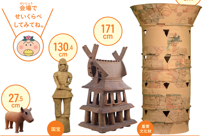
子馬形埴輪 大原府白旗郡市 忍が丘新瀬遺跡出土 古墳時代・6世紀 大原・白旗郡市教育委員会 (四條郡市立歴史民俗資料館保管) 埴輪 掛甲の武人 群馬県太田市藤原町出土 古墳時代・6世紀 東京国立博物館蔵 家形埴輪 大原府高槻市 今城塚古墳出土 古墳時代・6世紀 大原・高槻市教育委員会蔵 (今城塚古代歴史資料館保管) 円筒埴輪 奈良県東井市 メスリ山古墳出土 古墳時代・4世紀 奈良県立橿原考古学研究所附属博物館蔵